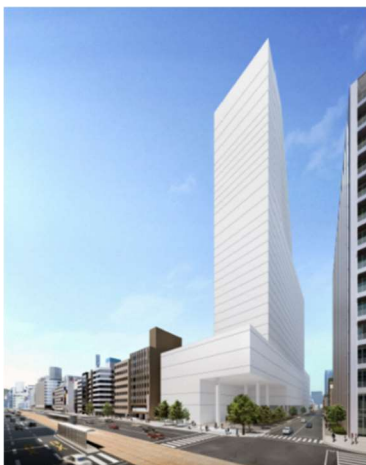
外観完成イメージパース

今後とも、引き続き本事業の早期実施に向けて、関係者一丸となり、着実に推進してまいります。